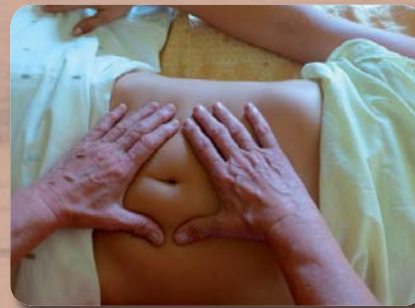
CHI NEI TSANG TAOISTISCHE BAUCHMASSAGE