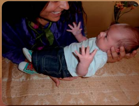
Tratamiento de bebés