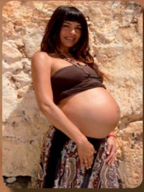
Acompañamiento del embarazo